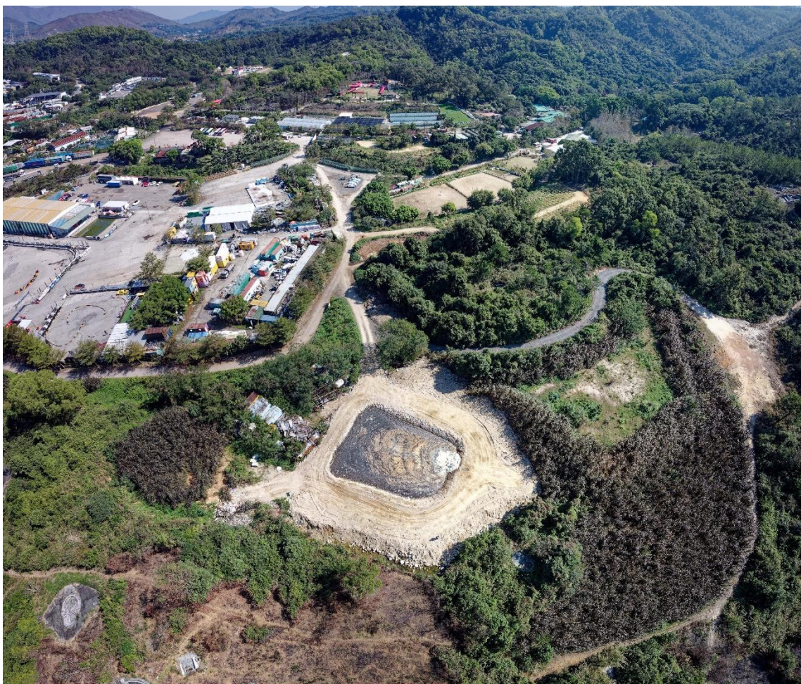
圖九：元朗大棠有機生態園後山的糞池

款 3,000 元及清理費用 2,093 元，即僅收回 0.16% 的相關開支 2 ，大部分的修復支出由公帑承擔。