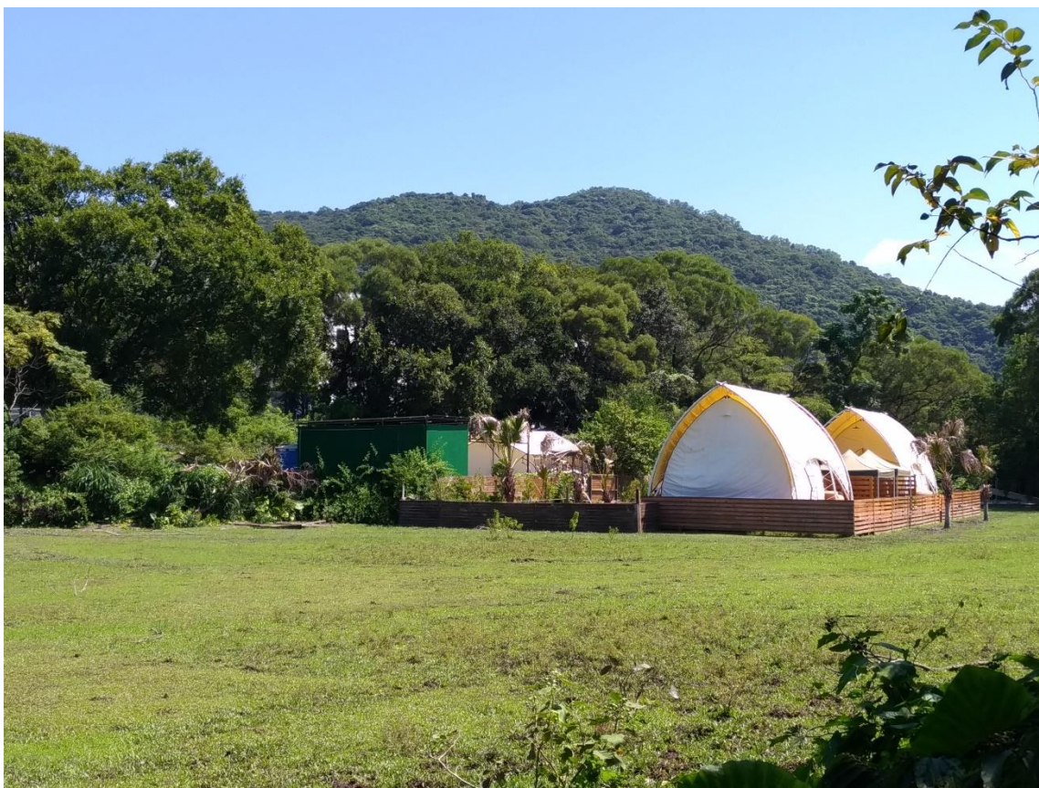
圖十二：2020年初起，貝澳有部分已平整的濕地上搭有疑似臨時構築物，經營私人收費露營場

2021年8月，我們與多個環保團體與屋宇署及地政總署進行會議，會上我們理解屋宇署作為執法部門，若知悉該露營場未獲地政總署根據第121章《建築物條例(新界適用)條例》發出豁免證明書，理應可根據第123章《建築物條例》執法，然而我們從會上的溝通中，留意到地政總署與屋宇署之間似乎沒有主動聯繫溝通，變相拖延了執法工作，令露營場仍能長時間違法經營。