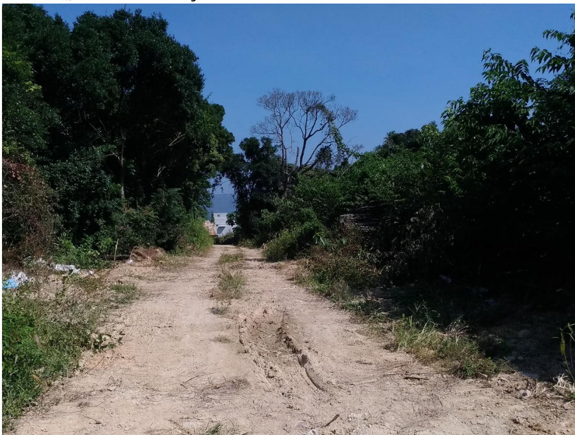
圖八：通往「自然保育區」地帶的一段路，中間的一段屬政府土地，然而現場所見，政府土地上未有放置任何告示、石屎柱、圍網等

電話 Tel.: (852) 2728 6781 傳真 Fax.: (852) 2728 5538 電子郵件 E-mail: cahk@cahk.org.hk