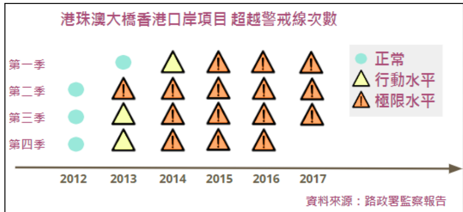
圖二：港珠澳大橋香港口岸環境監察防線長期失守

過往港珠澳大橋香港口岸項目的《監察終期報告》，工程的22個季度期間，共有3個季度的海豚數量超越「行動水平」，15個季度超越「極限水平」，換言之觸發「極限水平」持續足足三年半（見圖二）。雖然項目倡議人確認海豚數量觸發「極限水平」與進行的工程有關，但沒曾停工，也沒有按行動計劃和指引去採取足夠補救措施，只純粹增加監察，以上的建議獲環保署接納。